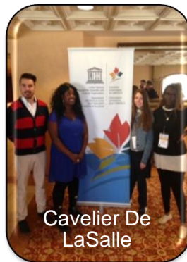
Cavalier De LaSalle