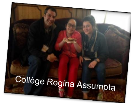
Collège Regina Assumpta